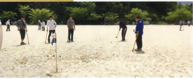
頑張って歩きました!!