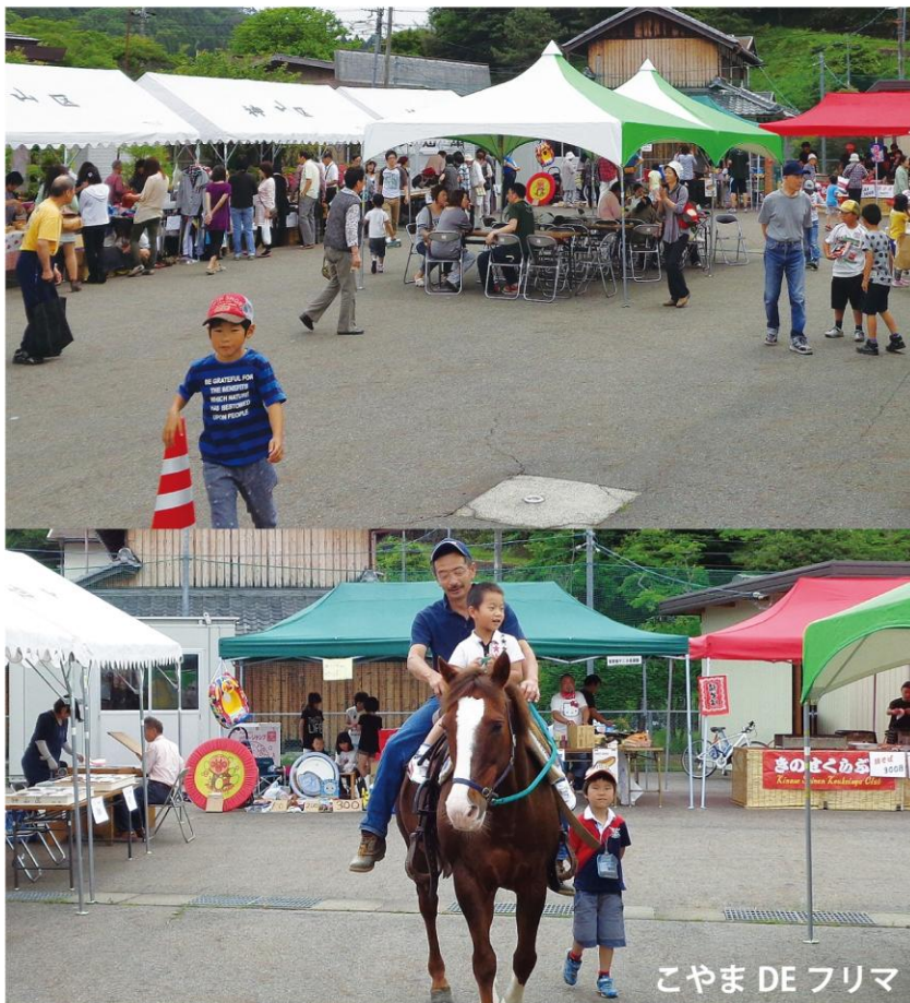
こやま DE フリマ